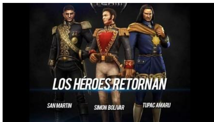
ILUSTRACIÓN DE HÉROE PERUANO DEL SIGLO XXI